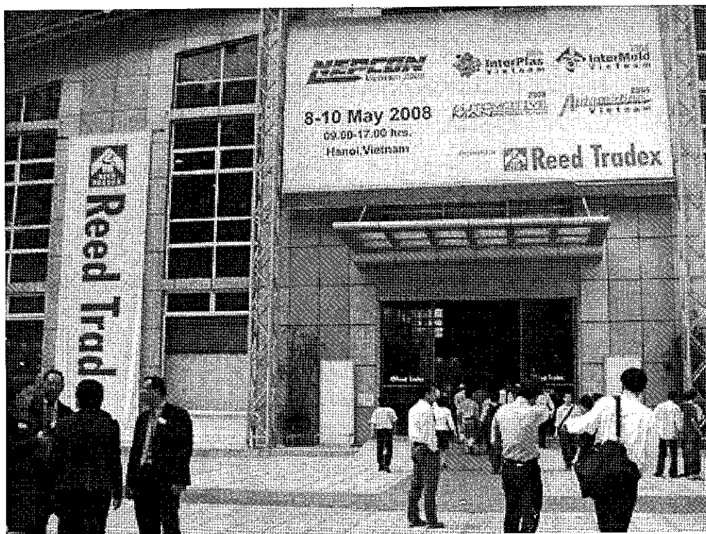
Triển lãm Vietnam Manufacturing Expo năm 2008 diễn ra tại trung tâm triển lãm quốc tế Hà Nội.

Đây sẽ là cơ hội để các doanh nghiệp sản xuất thuộc ngành công nghệ phụ trợ và chế tạo điện tử Việt Nam giao thương, tìm hiểu những công nghệ tiên tiến đến từ hơn 450 hãng sản xuất của 20 quốc gia và vùng lãnh thổ.